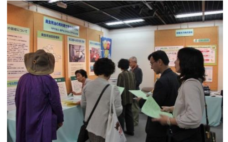
「アウル」の会のアトラクション 廃食用油でクルマが動くんだった！！