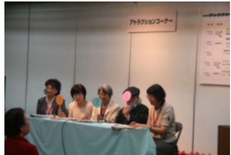
アトラクション風景・・・

平成19年10月5日(金)～7日(日) 会場：「アトスポットまつど」伊勢丹松戸店新館9階 主催：松戸市 企画運営：松戸市消費生活展実行委員会 テーマ：「生活を見直す・地球を見直す」