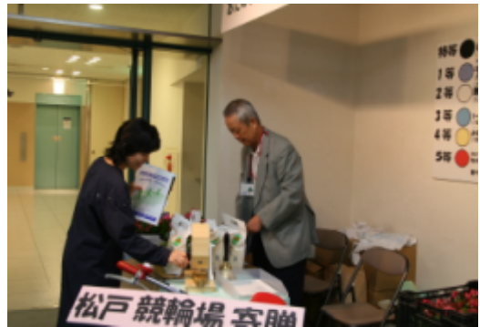
恒例の楽しい抽選会・・・

平成19年10月5日(金)～7日(日) 会場：「アトスポットまつど」伊勢丹松戸店新館9階 主催：松戸市 企画運営：松戸市消費生活展実行委員会 テーマ：「生活を見直す・地球を見直す」