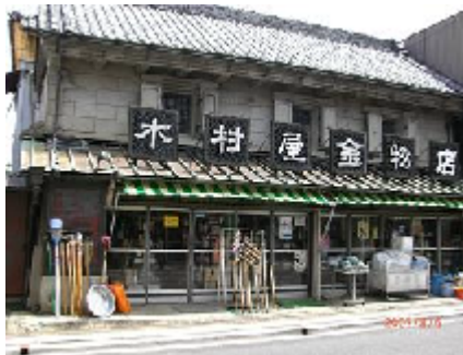
古い店舗が多く残っている久留里の町並み