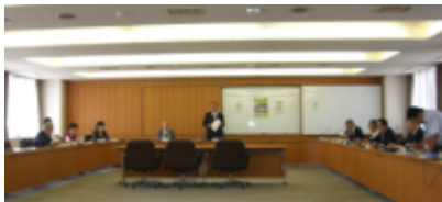
松戸市役所、7階大会議室にて行いました