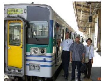
木更津駅で、久留里線に乗り変えて