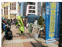
昨年の 「みらいフェスタ2017」

みらいフェスタ2018 平成30年3月24日(土) 松戸駅西口デッキ 10:30~15:30 テーマ:【こどもは、みらいへ】